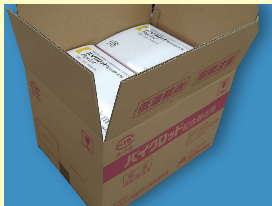
段ボール (中間箱6セット入)